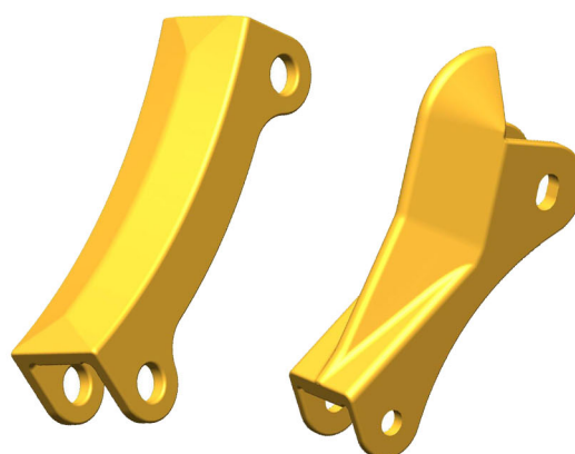
RIPPER PROTECTORS • CAT® • KOMATSU®

Le parti di usura G.E.T. (Ground Engaging Tools) sono il risultato di intense ricerche e progettazioni finalizzate a fornire un'eccellente performance. L'attenta selezione dei materiali più adeguati ed i trattamenti termici appropriati assicurano le caratteristiche migliori ed un giusto equilibrio tra resistenza e durabilità. Le parti G.E.T. ITR sono caratterizzate da un continuo rinnovamento produttivo grazie all'utilizzo delle più recenti implementazioni tecnologiche e degli elevati standard qualitativi nei processi produttivi. ITR ha sviluppato un'ampia gamma di ripper e relativi accessori, prevalentemente per macchine Caterpillar® e Komatsu®, relativi ad applicazioni dozer e grader. Le gravose sollecitazioni alle quali sono sottoposti i ripper hanno richiesto un attento studio per garantire la massima resistenza e durata. Richiedi il nostro catalogo per visualizzare tutte le soluzioni offerte.