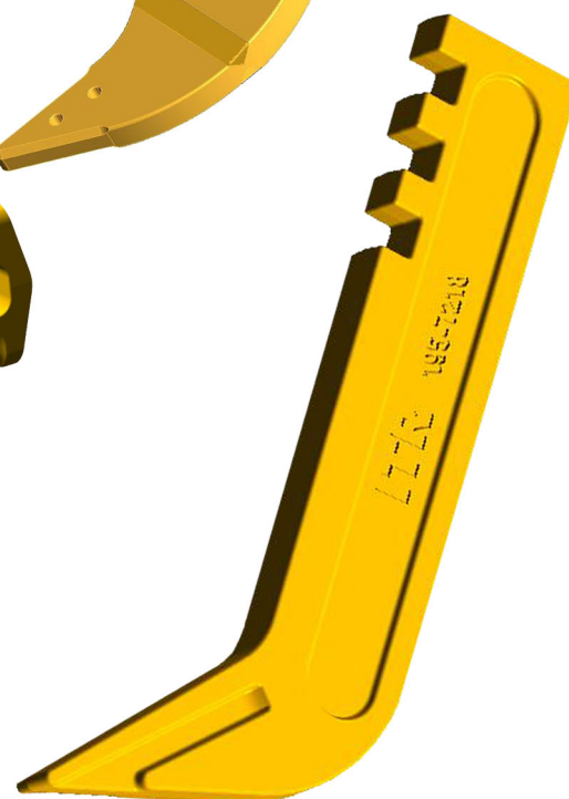
SCARIFIER SHANK • CAT® • KOMATSU®