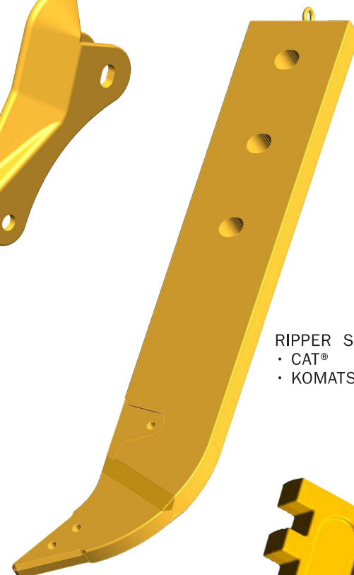
RIPPER SHANK • CAT® • KOMATSU®