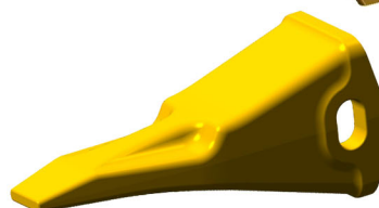
RIPPER TIP • CAT® • KOMATSU® • ESCO® • FIAT-HITACHI® • CNH®